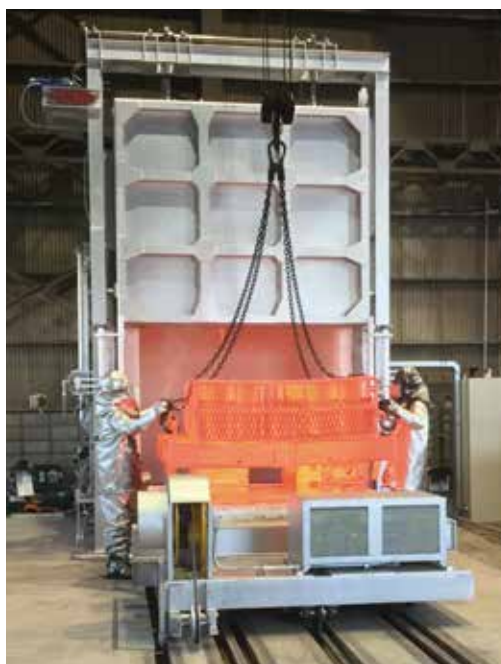
小型炉(最高加熱温度 950^{\circ}\text{C} )