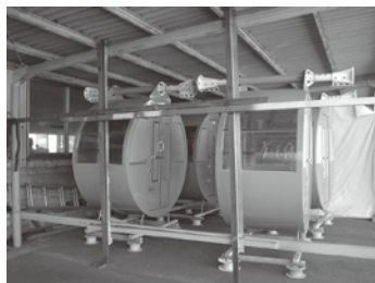
D社納 観覧車 本体塗装