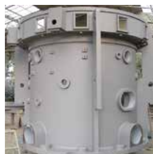
下塗り1回目 塗装後