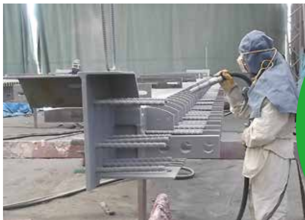
サンドブラスト作業風景

塗装がムラにならないよう、鉄の表面を均一にする事が難しく、長年の経験と匠の技で仕上げます。