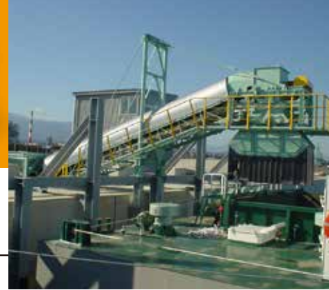
S市納 汚泥処理設備 現地塗装工事