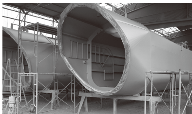
I社納 風力発電設備 本体塗装