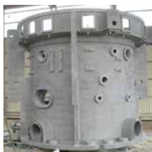
サンドブラスト処理後