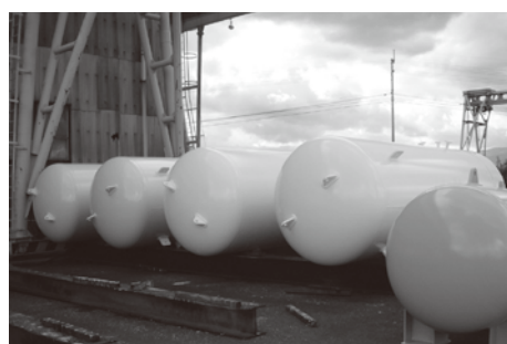
D社納 船舶用空気タンク 塗装