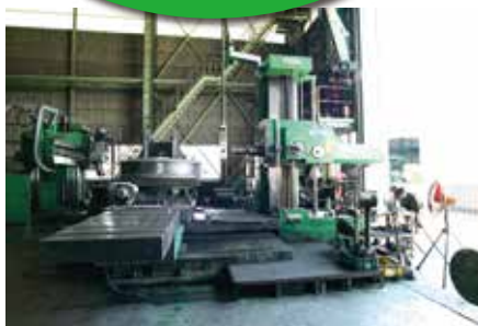
横中ぐり盤 φ130 1200W×2500L×1500Hmm