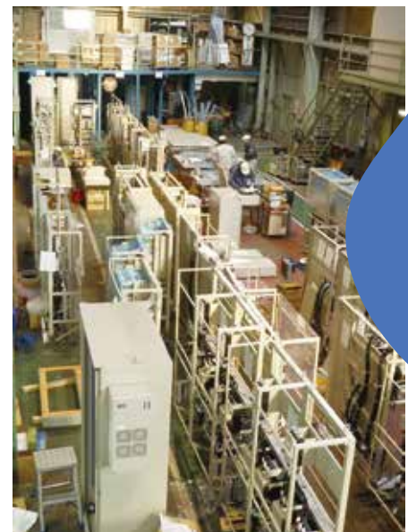
電装工場内風景 様々な制御盤の製作