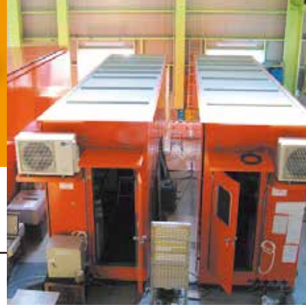
ゴライアスクリーン用電気室

大型電気室など設計から組立・最終検査まで対応。 関連企業との協業で一貫生産体制を実現。