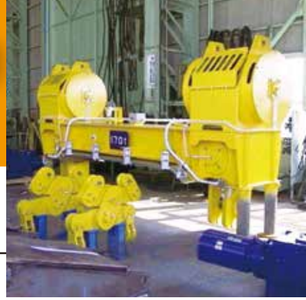
天井クレーン用吊り梁

天井クレーン・大型クレーンの機械加工組立 最大48mで重量60t級の製作が可能。