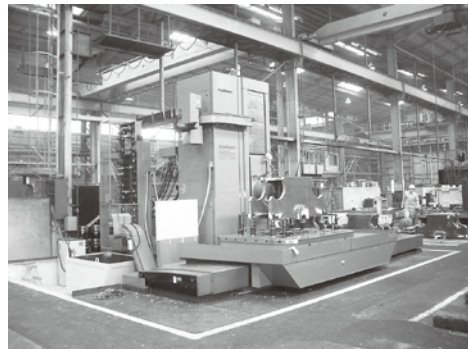
NC横中ぐり盤(テーブル)