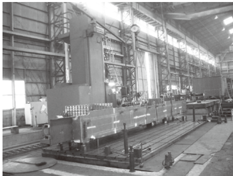
NC横中ぐり盤(フローア)