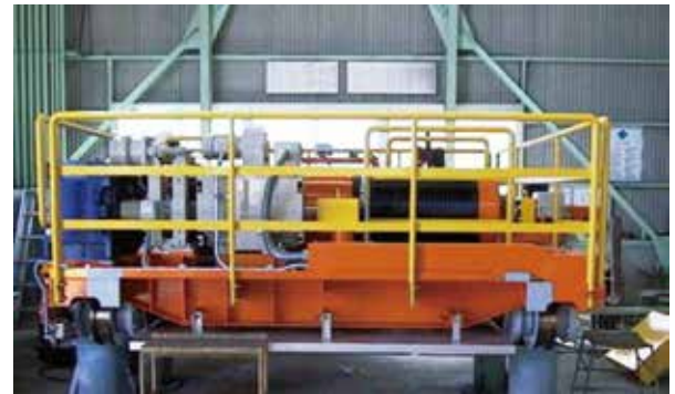
30t 天井クレーン用クラブA

高い溶接技術で 品質と信頼性を追求し、 クレーン等運搬荷役機械を 短納期で製造します。