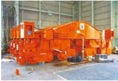
35.5t コンテナクレーン用走行装置

一貫生産体制を確立し、各部門で培った技術と厳正なチェックのもと、今までトラブルの発生は無く、 客先から信頼される製品を仕上げています。