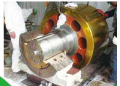
キルンサイドローラー整備

プラントメンテナンスを目標に発足以来、製缶・配管・仕上・彫・各種溶接・諸機械製作・修理及び据付等の業務を行っております。