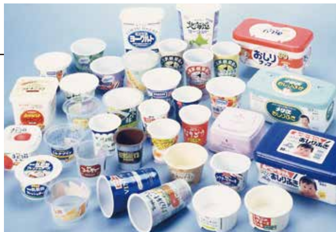
インモールドラベリングで成形した容器

ヤクルトのプラスチック容器はイズミ精機の射出成形機用の金型で作られています。 ラベルを容器の射出成形時に同時装着する「インモールドラベリング」対応の金型も製作できます。