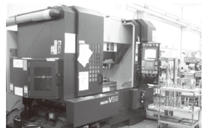
マシニングセンター