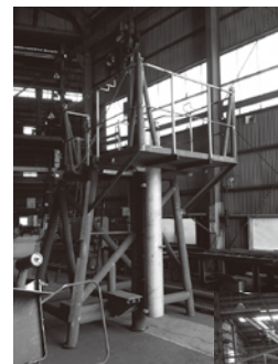
レーザーマスト アフトマスト