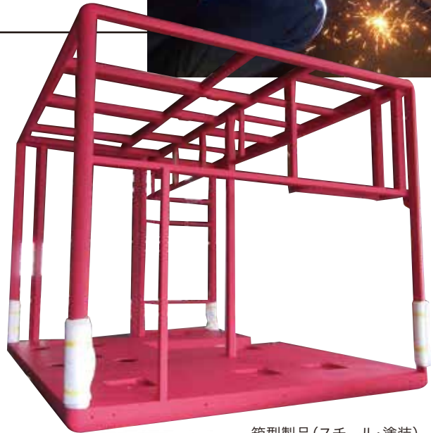
箱型製品(スチール・塗装)