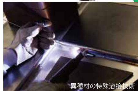
異種材の特殊溶接技術

スチール・ステンレス・アルミ・チタン等、様々な規格材料を歪みなく高精度に仕上げる溶接技術。さらに捻れやすい高張力鋼板(ハイテン780)とステンレス鋼という異種材を確実に溶接する特殊技術も有しています。