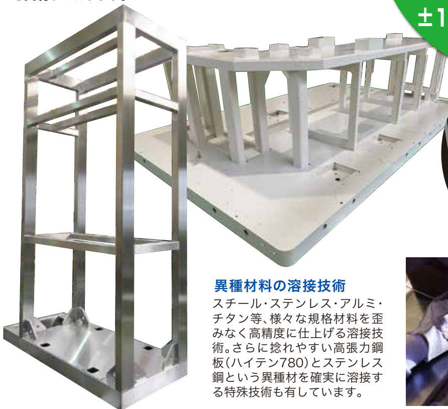
箱型製品(ステンレス)

レーザー切断から 製造、加工まで 一貫生産体制を確立し 高張力鋼板ハイテン780を用いた 10mの大型製缶溶接の製作 精度が厳しい大型の箱型製品は ±1mm以内の製作が可能