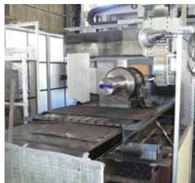
ロールの特殊加工(五面加工機)