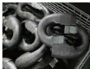
マシニングセンタ (組み立てチェーン)