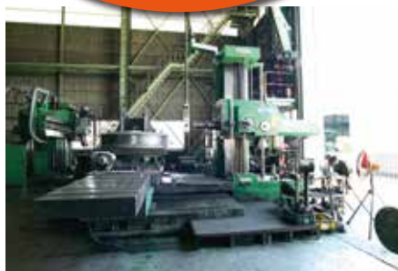
横中ぐり盤 φ130 1200W×2500L×1500Hmm