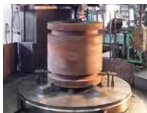
大型立旋盤 (製品の加工、圧延ロールの金型加工)

重量物の加工から縦旋盤による大型フランジ加工や マシニングセンタ・五面加工機による薄板平面加工、 穴あけ等の加工も行っております。