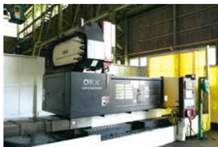
立型マシニングセンタ 2060×940×820mm